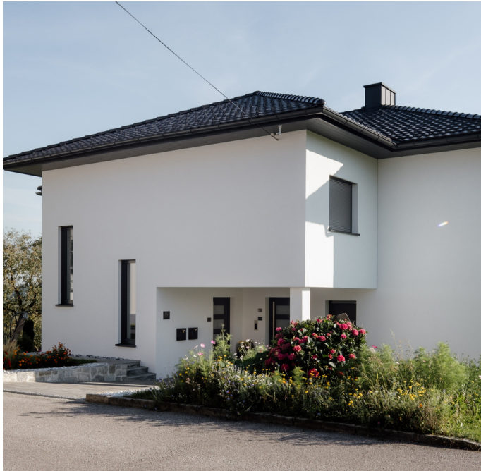
Totalumbau vom ursprünglichen Wohnhaus (siehe Bild unten)